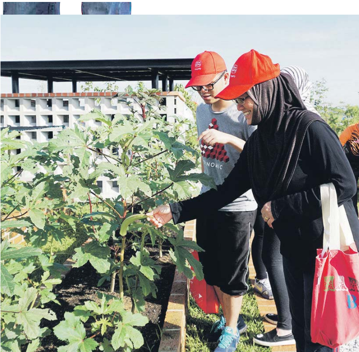
KOMUNITI yang terlibat di dalam projek ini akan mengetahui sumber makanan berkenaan diperolehi dan kebersihannya terjamin.

Beliau menambah, komuniti berkenaan kini giat bekerja dengan penduduk di Denai Alam dan Elmina Garden yang dalam usaha untuk memulakan kebun komuniti seumpama ini.