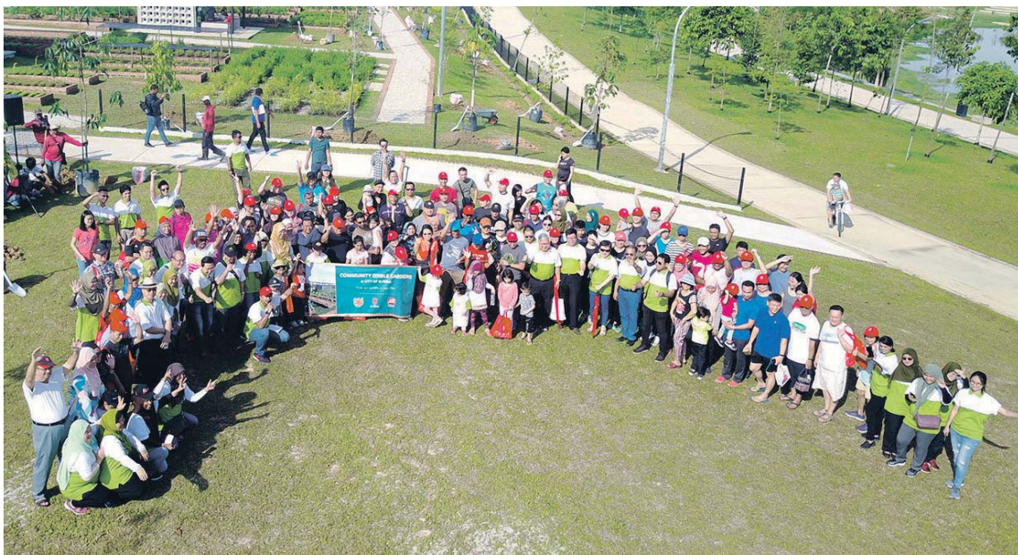
SEBAHAGIAN daripada penduduk yang menyertai kebun komuniti di Bandar Elmina merakamkan kenangan.