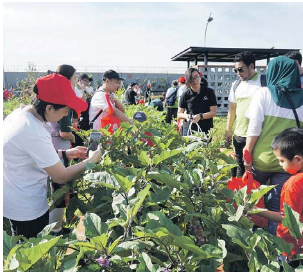
HASIL tanaman akan dikongsi bersama komuniti setempat.

"Sime Darby Property bukan sahaja bertujuan membina rumah dan persekitaran yang mampan bagi penduduk untuk hidup, tetapi juga memupuk masyarakat yang sihat," katanya.