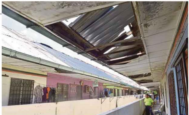
Masalah bumbung bocor dan rosak sudah berlarutan sejak 10 tahun lalu di Pangsapuri Bandar Bukit Tinggi, Klang.

"Yuran penyelenggaraan juga semakin mahal iaitu RM50 sebulan dan makcik perlu membayarnya kerana bimbang bekalan air dipotong kerana bil tertunggak.