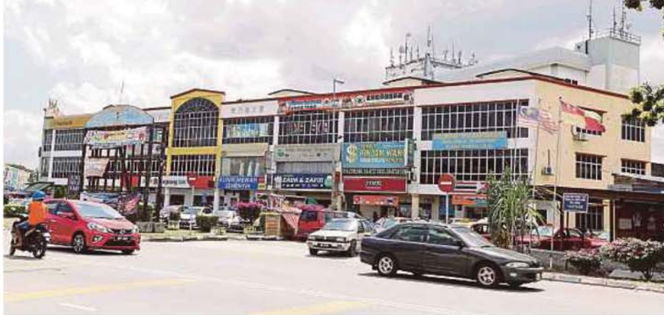
Semenyih is the sixth constituency to have a by-election since the 14th General Election. FILE PIC